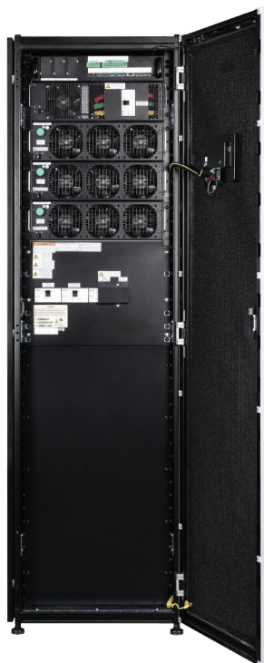
75kW 93PR Std

系統有能力吸收錯誤，並保持理想的營運狀態是降低高成本的停機最重要的部分。93PR 整合電子及 IT 基礎架構，更進一步提升運用的彈性。