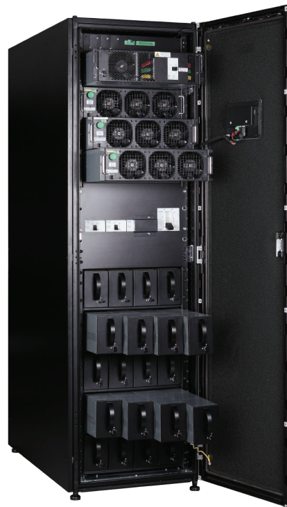
75kW 93PR VRLA