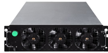
25kW 熱插拔 UPM