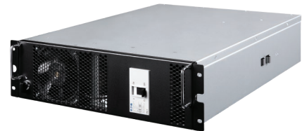
75kW 熱插拔 ATS