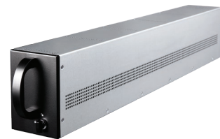
10*1234w VRLA 電池模組